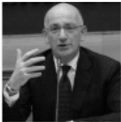
Francesco Paolo Sisto